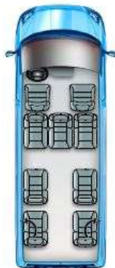
Pohjakaavio A22 (K9)