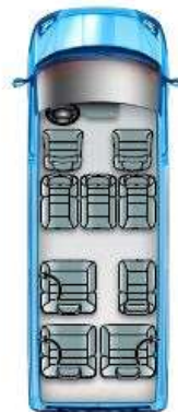
Pohjakaavio A14 (K12)