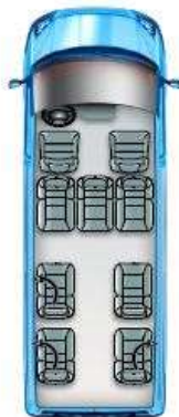
Pohjakaavio A23 (K9)