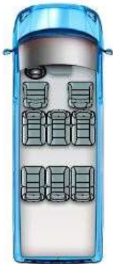
Pohjakaavio C (K8)

Peruspaketteihin kuuluvan vakiotuotteen jäädessä pois, on hyvityshinta 80 % tuotteen tai varusteen myyntihinnasta, ellei muuta hyvityshintaa ole mainittu.